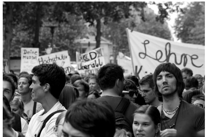
Wisst ihr noch, letzten Dienstag?

Um auch im UKE viele potenzielle Mitstreiter in die Auseinandersetzung für die menschenwürdige Entwicklung von Wissenschaft und Gesellschaft zu involvieren, wollen wir am Donnerstag einen Aktionstag im UKE machen – auch in den Ferien erkranken zu viele Menschen unter den unmenschlichen Verhältnissen! Es soll daher einen Info-Tisch im Foyer des Klinik-Neubaus geben sowie mobile Unterschriftensammlungen auf Stationsfluren usw. Treffpunkt ist Donnerstag, 10 Uhr in der Villa, Gebäude O 31 des UKE-Geländes.