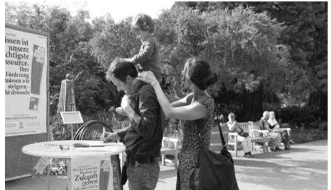
Unterschriften sammeln im Botanischen Garten

Heute und morgen lädt die MIN-Fakultät unter dem Motto Ideenwelt & Sofaworkshop alle – Bürger, Studierende, Schüler und Lehrende – zur öffentlichen Diskussion